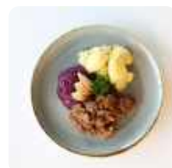
Runderhache met rode kool en aardappelen