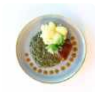
Rundervink met spinazie en aardappelen