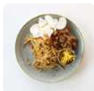
Kipsate bami goreng met satésaus