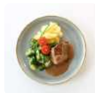
Varkenshaas met broccoli en aardappelen