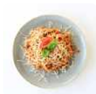
Spaghetti bolognese met gehakt

We hebben een samenwerking met de gemeente Etten-Leur voor inwoners die in aanmerking komen voor de reductieregeling.