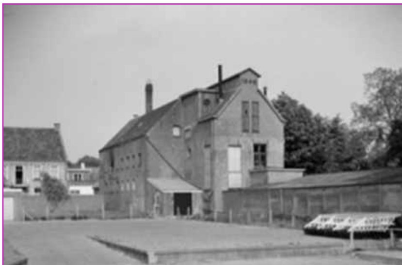
De "Cambrinus Brouwerij" in 1964

brouwer te Gilze, de brouwerij en mouterij (Markt 13) en het woonhuis (Markt 11) in totaal voor 6.700 gulden. Hij kocht de brouwerij voor zijn oudste zoon Cor van Poppel. De brouwerij kreeg een nieuwe naam "Cambrinus Brouwerij". Kort na de overname vond een grote interne verbouwing plaats.