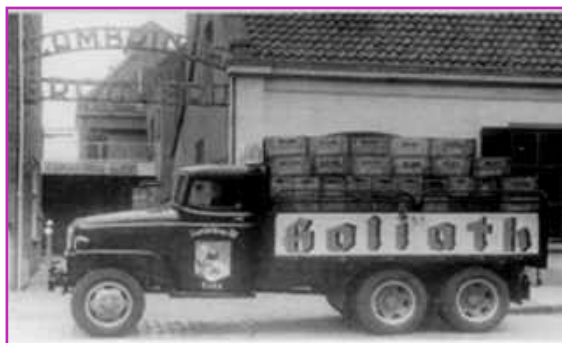
Het wagenpark van de "Cambrinus Brouwerij" op de Markt.

de pils. In 1938/39 werd het oude huis Markt 11 gesloopt en werd een nieuwe moderne woning gebouwd.