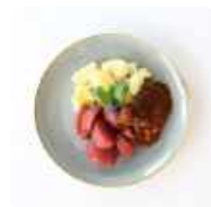
Sucadelap met stoofperen en aardappelen