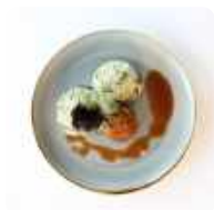
Runderbal met andijvie stampot