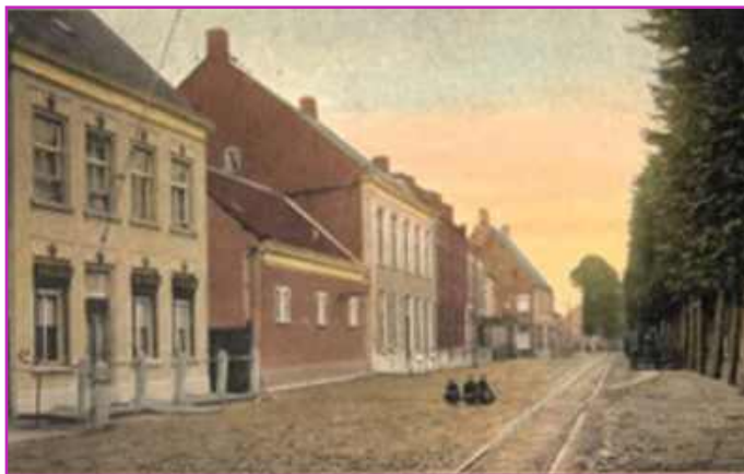
Markt 11 t/m 17 begin 1900

Zoals ieder dorp telde Etten-Leur in het verleden vele bierbrouwerijen. Eind 19de eeuw kwam daar ter hoogte van Markt 11 t/m 17 een nieuwe brouwerij bij.