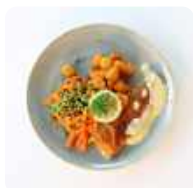
Lekkerbek met doperwten krielaardappelen