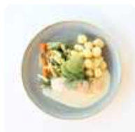
Zalmfilet met groentemix en hollandaise saus