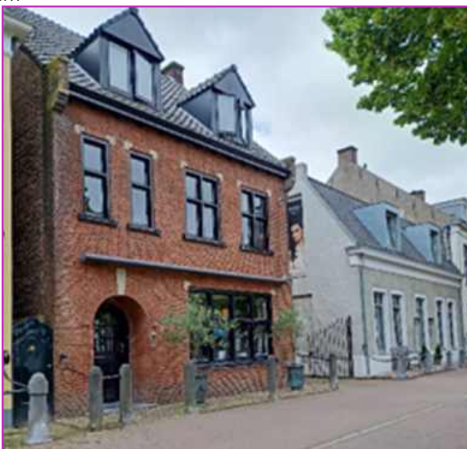
Markt 11 t/m 15 anno 2024.

bestemming. De gebouwen op de Markt staan er nog. Op Markt 11 zit nu een kapsalon en op nr. 15 in het koetshuis zijn nu appartementen gerealiseerd. Daartussen is nog de oude ingang van de brouwerij, ooit Markt 13.