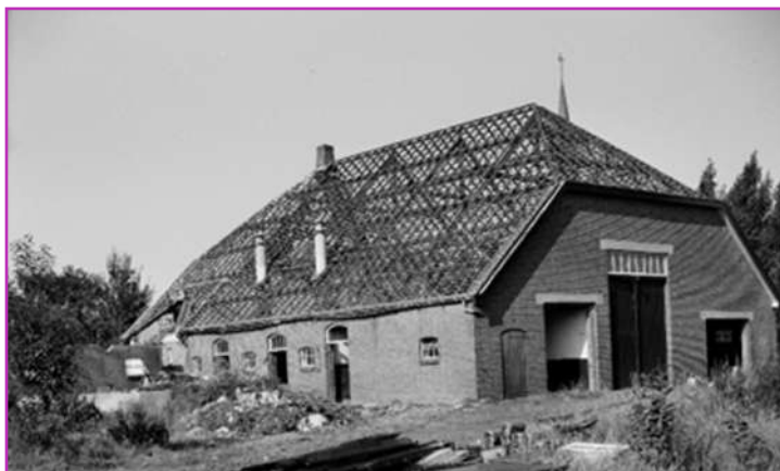
De boerderij van het gasthuis ca. 1971

Op de hoek van de Oude Bredaseweg en de Anna van Berchemlaan stond vroeger de boerderij van het Gasthuis. Het Gasthuis was zelfvoorzienend, zij hielden koeien voor de melk, varkens voor het vlees en kippen voor de eieren. Ook had het Gasthuis een moestuin. Men had twee betaalde krachten in dienst voor de boerderij, die bijgestaan werden door bejaarde bewoners die fysiek hiertoe nog in staat waren.