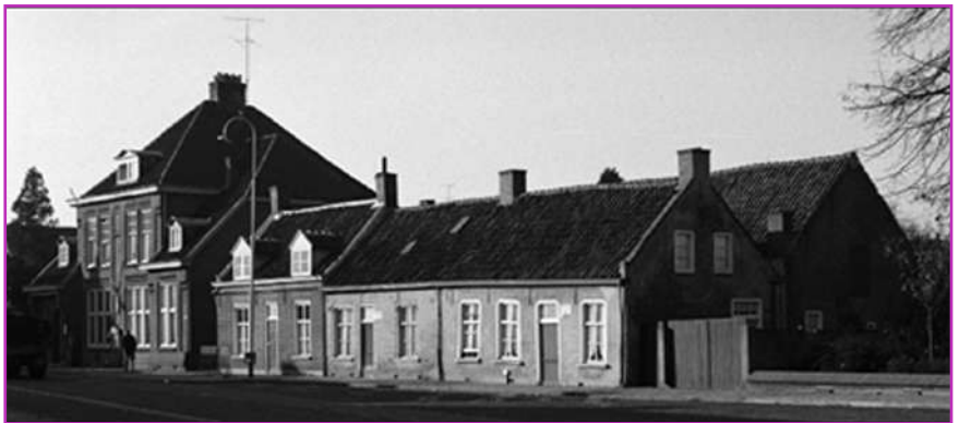
De huisjes Oranjeplein 1 t/m 4

Omnummering Oranjeplein uit het Adresboek 1949 van de Gemeente Etten en Leur.