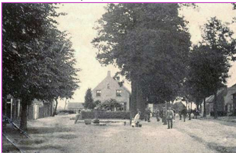
Oranjelaan 11 en 12

In 1971 werden alle gebouwen op het terrein van het Sint-Elisabethsgasthuis, met uitzondering van de kapel, gesloopt voor de inrichting van het Ouderkerkpark.