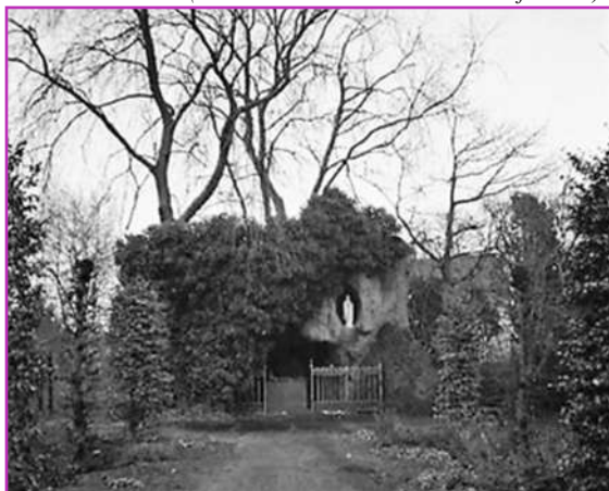
Lourdesgrot St Elisabethsgasthuis 1971

Op de hoek van de Oude Bredaseweg en de Anna van Berchemlaan stond vroeger de boerderij van het Gasthuis. Het Gasthuis was zelfvoorzienend, zij hielden koeien voor de melk, varkens voor het vlees en kippen voor de eieren. Ook had het Gasthuis een moestuin. Men had twee betaalde krachten in dienst voor de boerderij, die bijgestaan werden door bejaarde bewoners die fysiek hiertoe nog in staat waren.