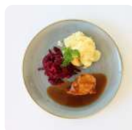
Kipfilet met rode bieten, appel aardappelen