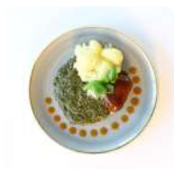
Rundervink met spinazie en aardappelen