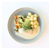
Zalmfilet met groentemix en hollandaise saus