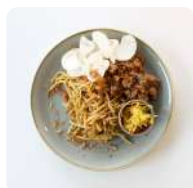
Kipsate bami goreng met satésaus