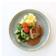
Varkenshaas met broccoli en aardappelen