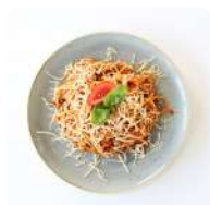
Spaghetti bolognese met gehakt

We hebben een samenwerking met de gemeente Etten-Leur voor inwoners die in aanmerking komen voor de reductieregeling.