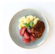
Sucadelap met stoofperen en aardappelen