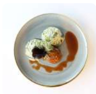
Runderbal met andijvie stampot