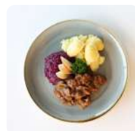
Runderhache met rode kool en aardappelen