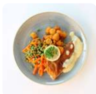
Lekkerbek met doperwt en krielaardappelen