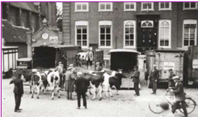
De kosterwoning op de Markt ca. 1915 (links). Het lossen van koeien voor de veemarkt voor het oude gemeentehuis en de kosterwoning op de Markt in Etten (rechts).