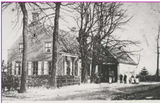
Non Plus Ultra in 1901, op de kopgevel 'Hotel', boven de deuren van de uitspanning 'Non Plus Ultra' en op de zijgevel van de uitspanning 'Etten en Halte der stoomtram')