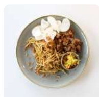
Kipsate bami goreng met satésaus