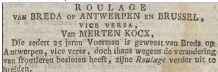
uitbreiding van de vervoersdienst naar Brussel door Merten Kocx (advertentie Bredasche courant 5 april 1817)

kans en kocht voor 68 gulden de spie van de familie Oostrijk en bouwde er het hotel "Non Plus Ultra".