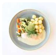
Zalmfilet met groentemix en hollandaise saus