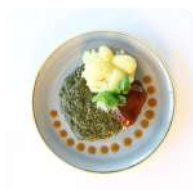
Rundervink met spinazie en aardappelen