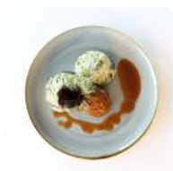
Runderbal met andijvie stampot