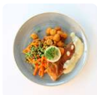
Lekkerbek met doperwt en krielaardappelen