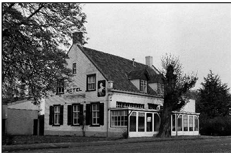
Het Witte Paard in 1977

Vanaf 1950 verhuurde de brouwerij het aan de familie Martens uit Baarle-Nassau. Zij veranderden de naam in 'Het Witte Paard'. Het werd weer een bloei-