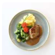
Varkenshaas met broccoli en aardappelen